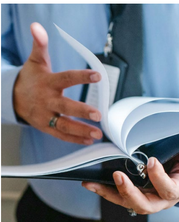
Ein Blick in die Versicherungsbedingungen – gerne durch uns – erleichtert die bedarfsgerechte Risikoeindeckung.

Bewegen Sie sich im Rahmen der Mindestversicherungssummen, ist gesetzlich vorgeschrieben, wie Ihre Maximierung oder auch Jahreshöchstleistung ausgestaltet ist. Darüber hinaus können Sie die Maximierung oft frei wählen. Üblicherweise bieten die Versicherer stets eine 2-fache Maximierung an. Es ist aber durchaus anzuraten, zu überprüfen, ob nicht eine höhere Versicherungssumme mit 1-facher Maximierung passender für Ihre Kanzlei ist. Hierzu sollte Ihr Versicherungsmakler mit Ihnen die Mandatsstruktur analysieren.